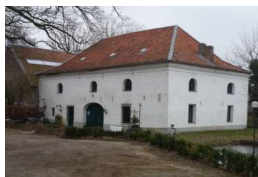
Gebäude in Privatnutzung

Wassermühle Millen Zum Haus Millen 52538 Selfkant-Millen Koordinaten für GPS 51,0248704° Nord 05,8771008° Ost