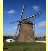
Mühle in Betrieb

Windmühle Clarissa Kirchhoven Zur Kornmühle 7 52525 Heinsberg-Kirchhoven Koordinaten für GPS 51,0772342° Nord 06,0623771° Ost