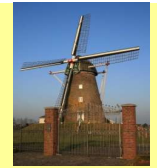
Mühle in Betrieb

Windmühle Haaren Elsweg 52525 Waldfeucht-Haaren Koordinaten für GPS 51,0856508° Nord 06,0366306° Ost