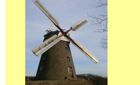
Mühle in Betrieb

Windmühle Breberen Waldfeuchter Straße / K17 52538 Gangelt-Breberen Koordinaten für GPS 51,0323637° Nord 05,9887666° Ost