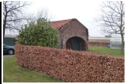
Rest als Scheune genutzt

Mühlenstumpf Dampfmühle Dampfmühle 52525 Waldfeucht Koordinaten für GPS 51,0549848° Nord 06,0087597° Ost