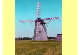
Mühle in Betrieb

Windmühle Waldfeucht Kapellenstraße 52525 Waldfeucht Koordinaten für GPS 51,061327° Nord 05,9860522° Ost