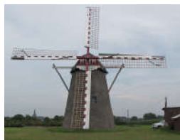
Mühle in Betrieb