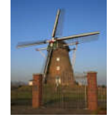
Mühle in Betrieb

Windmühle Haaren Elsweg 52525 Waldfeucht-Haaren Koordinaten für GPS 51,0856508° Nord 06,0366306° Ost