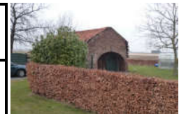
Rest als Scheune genutzt

Mühlenstumpf Dampfmühle Dampfmühle 52525 Waldfeucht Koordinaten für GPS 51,0549848° Nord 06,0087597° Ost