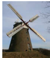
Mühle in Betrieb