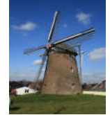
Mühle in Betrieb

Windmühle Kirchhoven Zur Kornmühle 7 (Lümbacher Mühle) 52525 Heinsberg-Kirchhoven Koordinaten für GPS 51,0772342° Nord 06,0623771° Ost