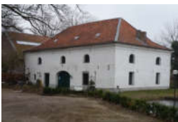
Gebäude in Privatnutzung

http://www.limburg-bernd.de/Muehlen/1%20Muehlenblatt.htm