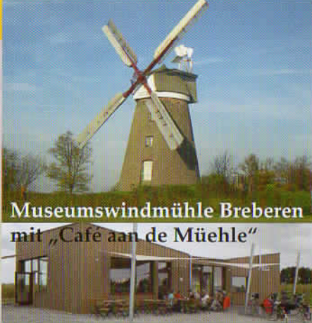
Museumwindmühle Breberen mit „Café aan de Mühle“

1842, Berg- oder Kellerholländer. Ihre Bilau-Metallflügel stammen aus der Hermannsmühle in Kevelaer. 1919 wurde der Mahlbetrieb aufgegeben und im Dorf mit elektrischem Antrieb weitergeführt. Im Zuge von