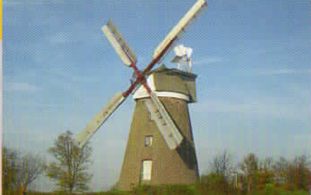
Museumswindmühle Breberen mit „Café aan de Mühle“

1842, Berg- oder Kellerholländer. Ihre Bilau-Metallflügel stammen aus der Hermannsmühle in Kevelaer. 1919 wurde der Mahlbetrieb aufgegeben und im Dorf mit elektrischem Antrieb weitergeführt. Im Zuge von